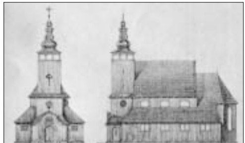
Szkic projektowanego kościoła. 1930

Nie dochodząc do Konstantynopola, drożyna na prawo prowadzi do Gór. Tu także sosna, a coraz zdaje się nową cudowna okoli-