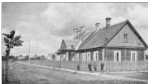
Szkola powszechna w Kolonii. Lato 30.

Każda droga gdzie się zaczyna. Potem koleje losu sprawiają, że o jej początkach się zapomina, by w dojrzałości życia powracać do wspomnień, zastanawiać, skąd się