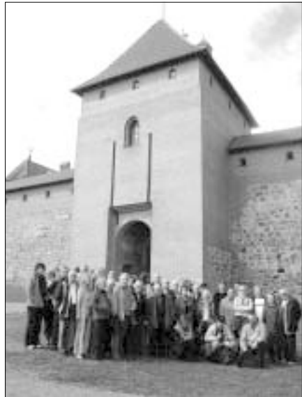
Uwiecznić się w Trokach, na tle zamku

ciństwa zakątką nad bystrą Wilenką. Powstał tu ośrodek wypoczynkowo-konsumpcyjny. Na miarę czasu – z kawiarniami i restauracjami, uporządkowanym parkiem i parkingiem, skwerami z zasianą i postrzyżoną