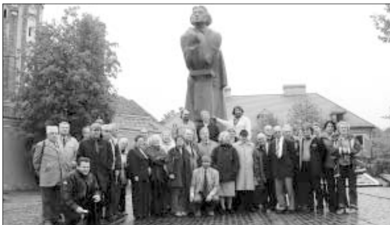
Inauguracja „Maja nad Wilią” nastąpiła pomniku Adama Mickiewicza