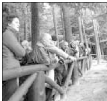
Spojrzyć na dzieciństwo pisarza. Poeci oglądają Kolonię Wileńską ze skarpy nad Wilenką