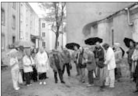
Poetom nie udało się wejść nawet na korytarz Celi...