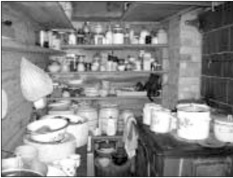
Rekwizyty dzisiejszej wiejskiej kuchni na Dzukii

rodowej łaźni rozściełano rodzającą jedwabne prześcieradło wraz z pasem. Położnice wyposażano w nóż, klucz i miotłę. Łotyśze wyobrażali sobie, że przed porodem Laima biega wokół budynku z rozpuszczonymi włosami, odpędzając złe duchy. Zatem położnica też na