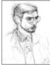
Rys. Lech Abłażej