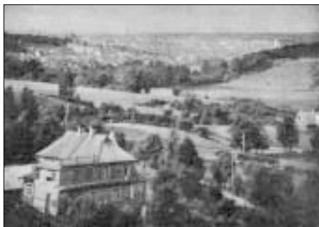
Kolonia Dolna z widokiem na Wilno. 1933