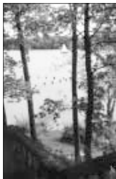
Pałac w Zatróczu i widok z tarasu

przyrody. Jednakże zarasta chwastami, dziczeje.